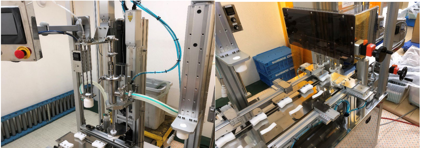
↑エアー洗瓶部・充填ノズル升降部・中栓打栓部 ↑中栓打栓部・キャッパー部